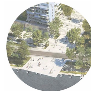
Création d'îlots de fraîcheur urbains Place des Athlètes – JO Paris 2024