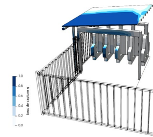
Gare de Meaux - Taux de capture au niveau des cabs