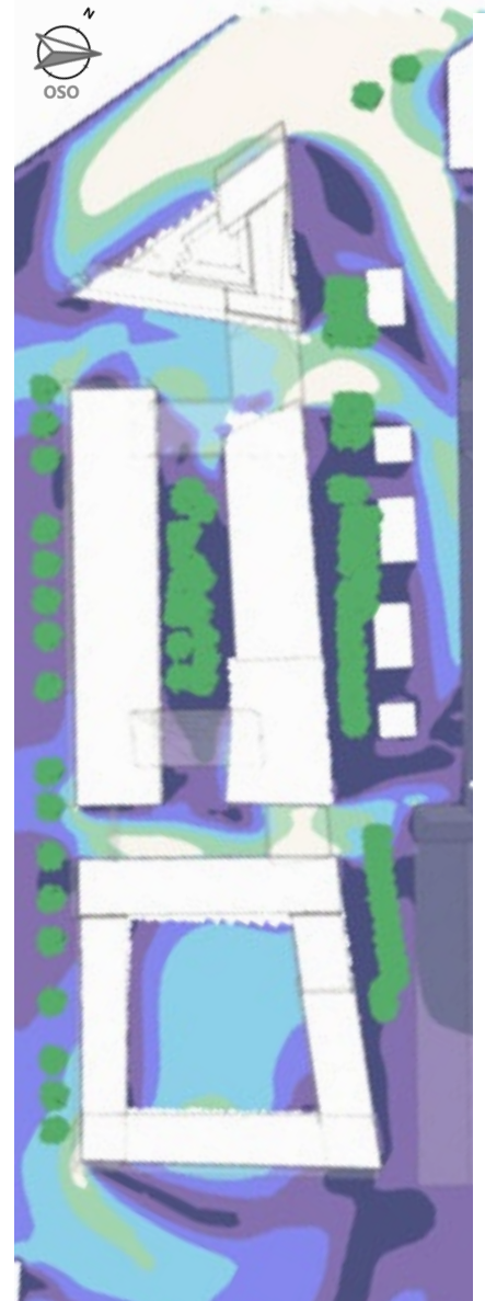
Carte des vitesses d'air avec végétation pour la direction de vent la plus impactante

Deux horizons climatiques, représentatifs du climat actuel et d'un scénario médian 2050, ont été comparés.